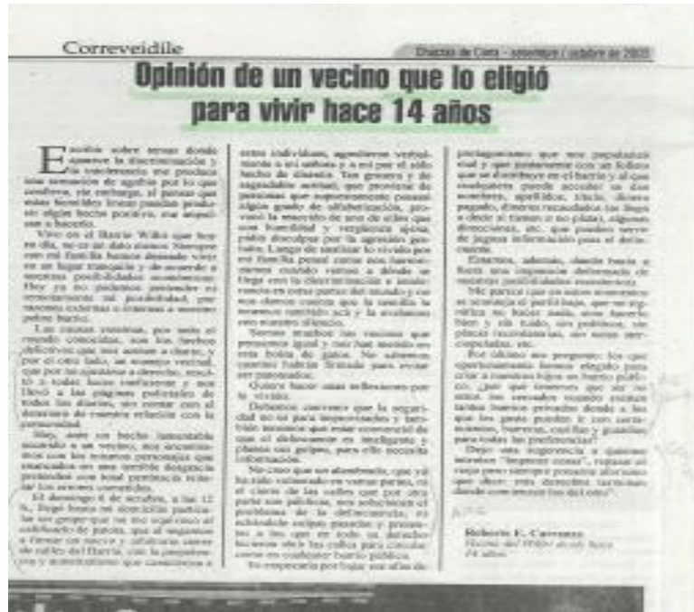
Fuente: Periódico Correveidile, Chacras de Coria, 09/10/2003