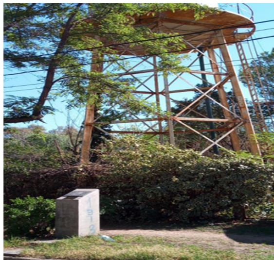
Foto: Monolito descubierto el día de inauguración del reordenamiento del barrio: el autocierre. Calle Justicia

Como respuesta a esta solicitud, el HCD solicita el análisis de la viabilidad de lo solicitado y el Municipio contesta que es factible el cierre, y que el barrio debería hacerse cargo de asfaltar las calles laterales, Liniers y Larrea, y otras medidas más dentro del barrio, como liberar las veredas (tema exclusivo del barrio Will Ri) y pagar las deudas de los propietarios ante el municipio. Mediante una resolución No: 62502-c-02 con fecha 10 de julio 2003. Inmediatamente comenzaron los cierres de calles, tan deseados por algunos y que sorprendió de manera violenta a los transeúntes habituales (ordenanza 62502 en anexos). En otra ordenanza, 292-2003, el HCD comunica a la Unión Vecinal, los plazos de las obras a cargo de esta (ordenanzas en anexos).