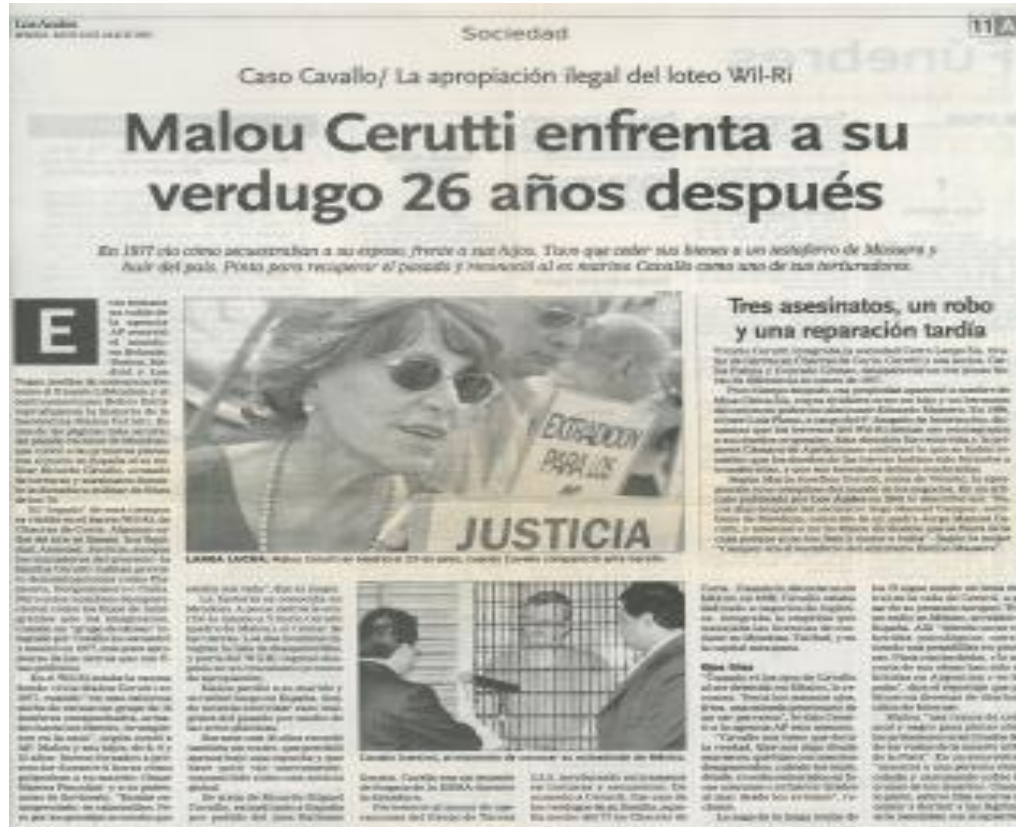
Fuente: Diario Los Andes. Mendoza 24/07/2003