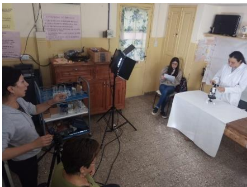
Figura 2. Proceso de grabación de los video tutoriales.

La figura 3 muestra el proceso de diseño exclusivo de las láminas y fichas técnicas y su formato final.