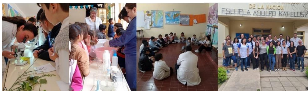
Figura 4- Jornada interactiva de Ciencias Naturales. A- Actividades prácticas con estudiantes. B- Charla- taller con docentes y directivos.

Las últimas acciones desarrolladas en la “Jornada Interactiva de Ciencias Naturales” involucraron la participación de toda la comunidad educativa (directivos, docentes y estudiantes) a través del desarrollo de actividades prácticas experimentales de química y biología, junto con juegos de gamificación temática que promovieron el aprendizaje lúdico y colaborativo (figura 4A). Como resultado, logramos incentivar el espíritu científico en niñas y niños, además de incorporar experiencias prácticas en el aula escolar que favorecen el aprendizaje de contenidos vinculados a las ciencias naturales. Como cierre del proyecto, se compartió un almuerzo y se realizó una charla taller con la directora y docentes para presentar los productos elaborados (figura 4B). Entre los productos entregados a la escuela se incluyó un documento completo —en formato impreso y digital— con el inventario detallado y todos los productos mencionados, además de las fichas y láminas técnicas también en ambos formatos. Se entregaron asimismo diversos elementos complementarios, como una fuente de luz externa para observación con el microscopio, lupas de mano, una micropipeta y algunos reactivos utilizados durante las experiencias. Finalmente, se brindaron pautas básicas para orientar el uso de los materiales y se generó un valioso intercambio de experiencias vinculadas a la tarea docente y de la importancia de incorporar actividades prácticas de las ciencias naturales en el aula escolar.